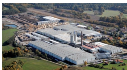
Chanovice, République Tchèque