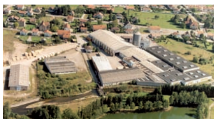
Saulcy sur Meurthe, France