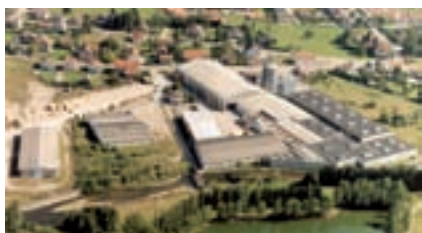
Saulcy sur Meurthe, Francie